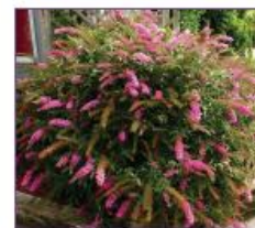
12. Vlindervriendelijke beplanting