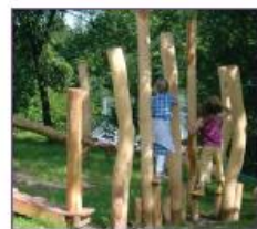
14. Houten stelten