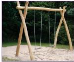
8. Dubbele schommel