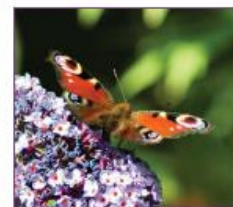
13. Viindervriendelijke beplanting