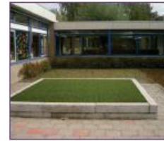
4. Podium van kunstgras