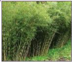
1. Bamboe bosjes t.b.v. beschutting en verstoppen