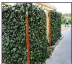
9. Groen verstopshot